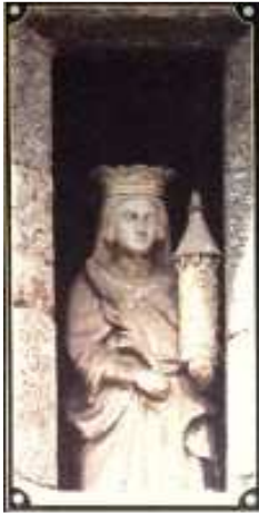
Chapelle Ste Barbe Bretagne

Les sapeurs pompiers, comme beaucoup de professions ou corporations, ont leur Saint. Pour nous, c'est une Sainte. Mais faisons un petit peu d'histoire pour faire sa connaissance.